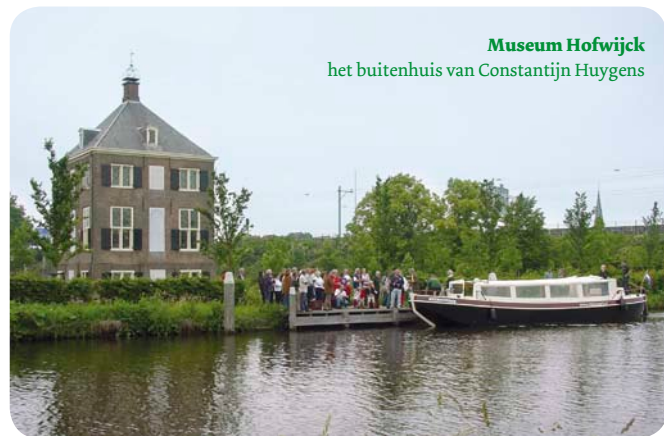
Museum Hofwijck het buitenhuis van Constantijn Huygens

Naast de boottochten waar een kaartje voor gekocht kan worden, is het mogelijk om één of meer boten van de Vlietvaart exclusief te huren voor uw gezelschap. Op deze manier ervaart u een bijzondere manier van vervoer tijdens trouwerijen, verjaardagen, bedrijfsuitjes of andere speciale gelegenheden. Daarbij kunt u aan boord eventueel genieten van een borrel, lunch, diner of muziek. Zie voor verschillende mogelijkheden onze website www.vlietvaart.nl . Reserveren en boeken kan telefonisch via De Ooievaart 070 445 18 69 .